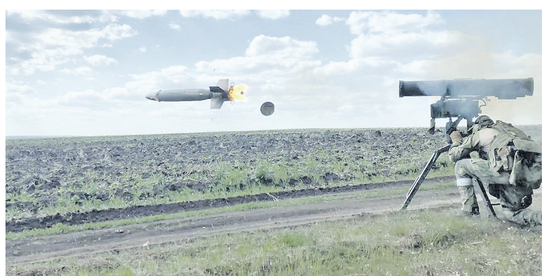
Мастерски владея вверенным оружием, противотанкисты успешно уничтожают нацистские бронетехники

Подготовил Евгений ГОРДЕЕВ