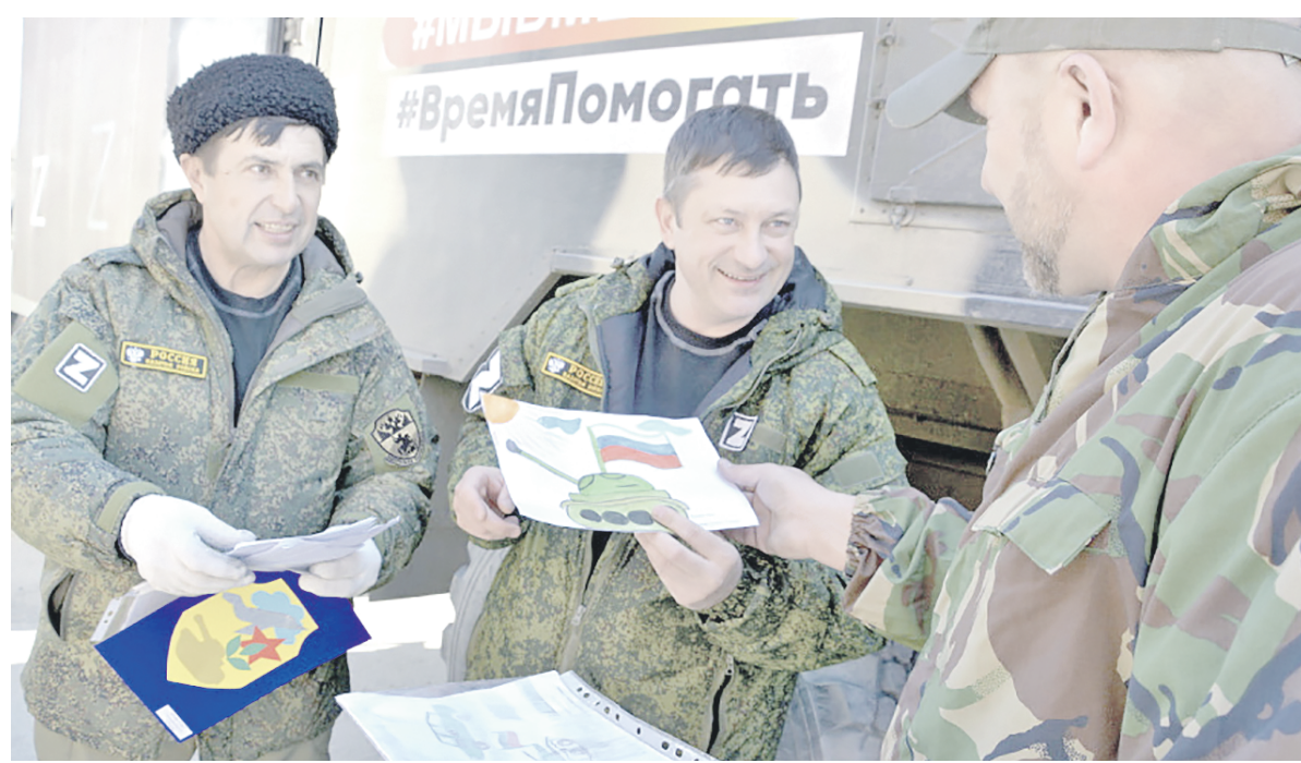
Казаки активно проводят мероприятия и акции в поддержку спецоперации российских войск

Ежедневно более тысячи добровольцев выходят в составе казачьих народных дружин на патрулирование приграничных с Украиной территорий, охрану социальных и других важных объектов, для противодействия террористам и мародёрам, обеспечения общественного порядка.